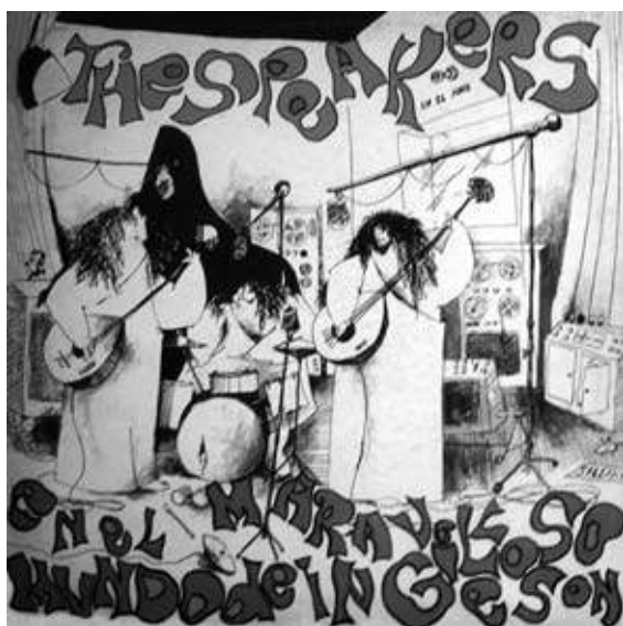
Tapa del álbum Los Speakers en el Maravilloso Mundo de Ingesón, 1968