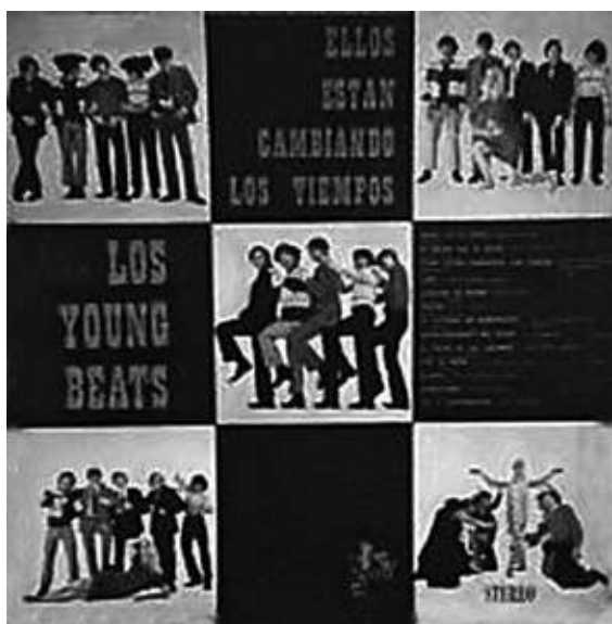
Tapa del álbum Los Tiempos Están Cambiando de Los Young Beats, 1966