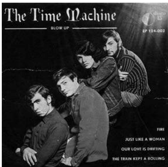
Tapa del álbum Blow Up de The Time Machine, 1967