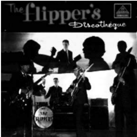
Tapa del álbum Discotheque de Los Flippers, 1966