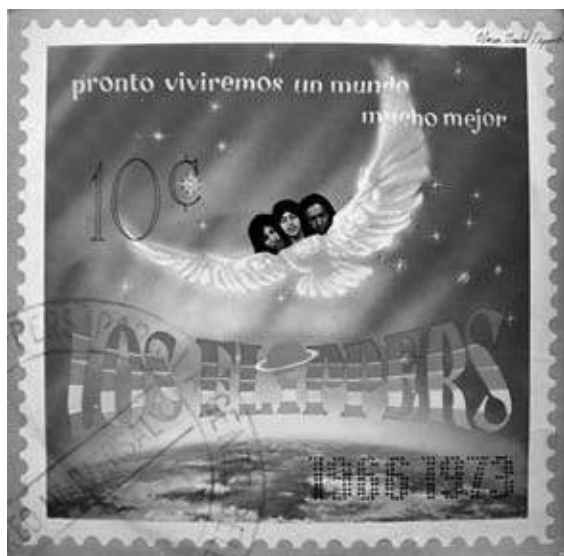
Tapa del álbum Pronto Viviremos un Mundo Mucho Mejor de Los Flippers, 1972