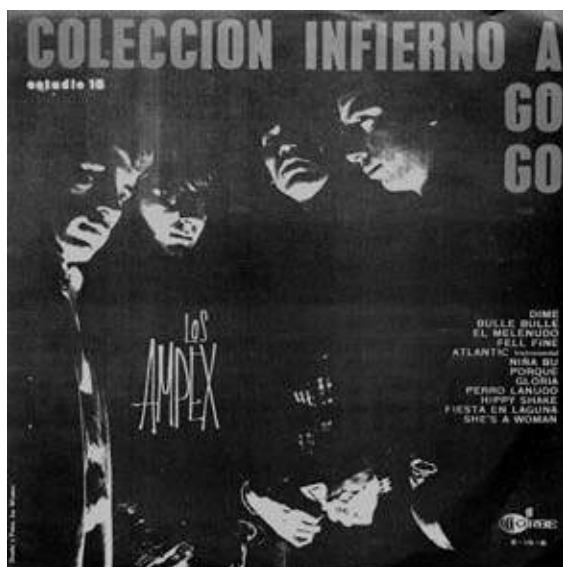
Tapa del álbum Colección Infierno a Go-Go de Los Ámpex, 1966