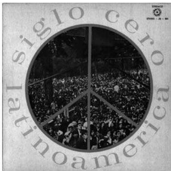
Tapa del álbum Latinoamérica de Siglo Cero, 1969