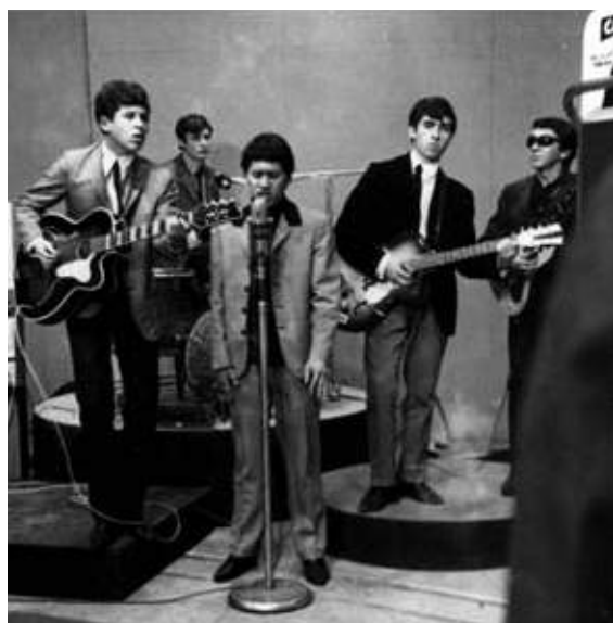
Presentación televisiva de Los Young Beats en el Canal Siete, 1965