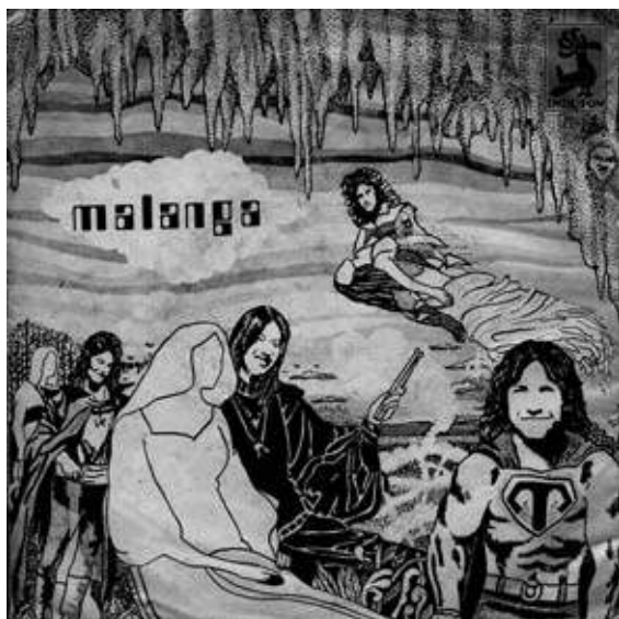
Tapa del disco sencillo Malanga , 1974