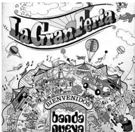
Tapa del álbum La Gran Feria de La Banda Nueva, 1974