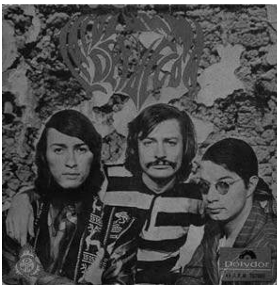
Tapa del disco sencillo La Columna de Fuego , 1972